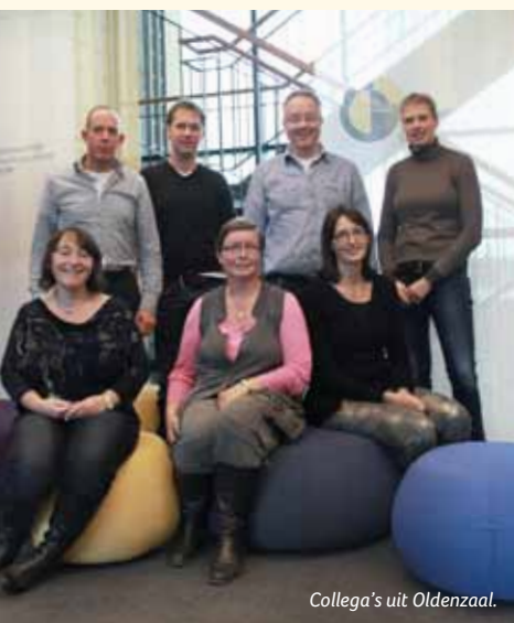
Collega's uit Oldenzaal.