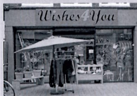
Wishes 4 you is gestart in 2011

U kunt zich voor deze dag gratis aanmelden via www.kvk.nl /startersdag. Hier vindt u ook meer informatie over het programma.